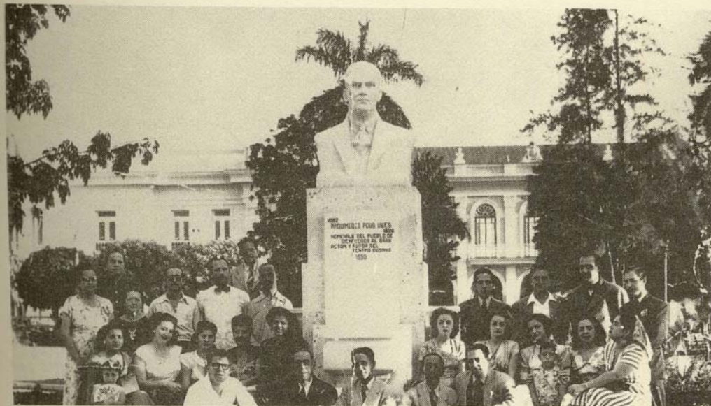
Inauguración del busto de Arquímedes Pous en el Parque Central de Cienfuegos frente al Teatro Terry. 30 de abril de 1950. El busto fue retirado del parque, en unas reformas que se hicieron al mismo después de 1960.